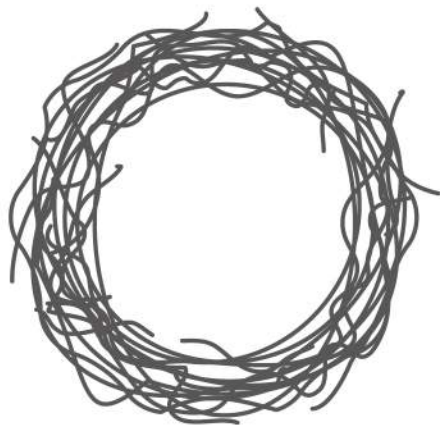
●サンキライリース 20 cm