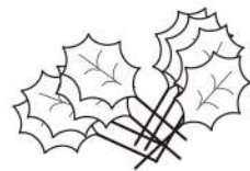
●ヒイラギ(グリーン) 8P