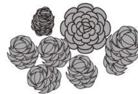
●オーナメントパック 松笠アソート NA