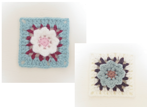
出来上がり寸法 9 cm × 9 cm